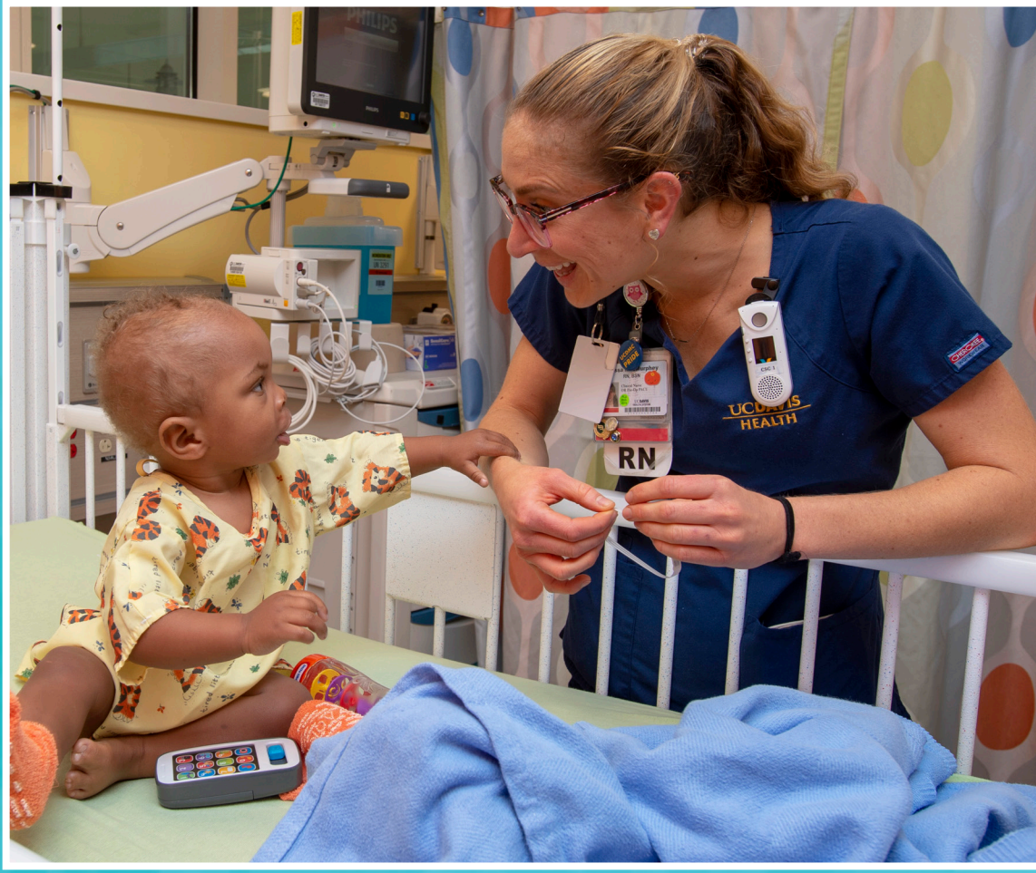
Centro de cirugía pediátrica de vanguardia, diseñado específicamente para las necesidades únicas de los niños