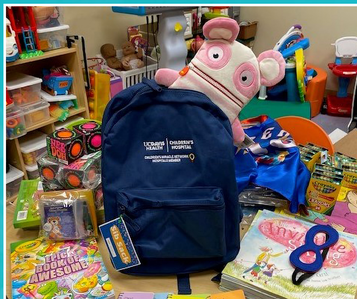
Los "Sib Sacs" ayudan a que los hermanos y hermanas comprendan y puedan afrontar la hospitalización de sus hermanos