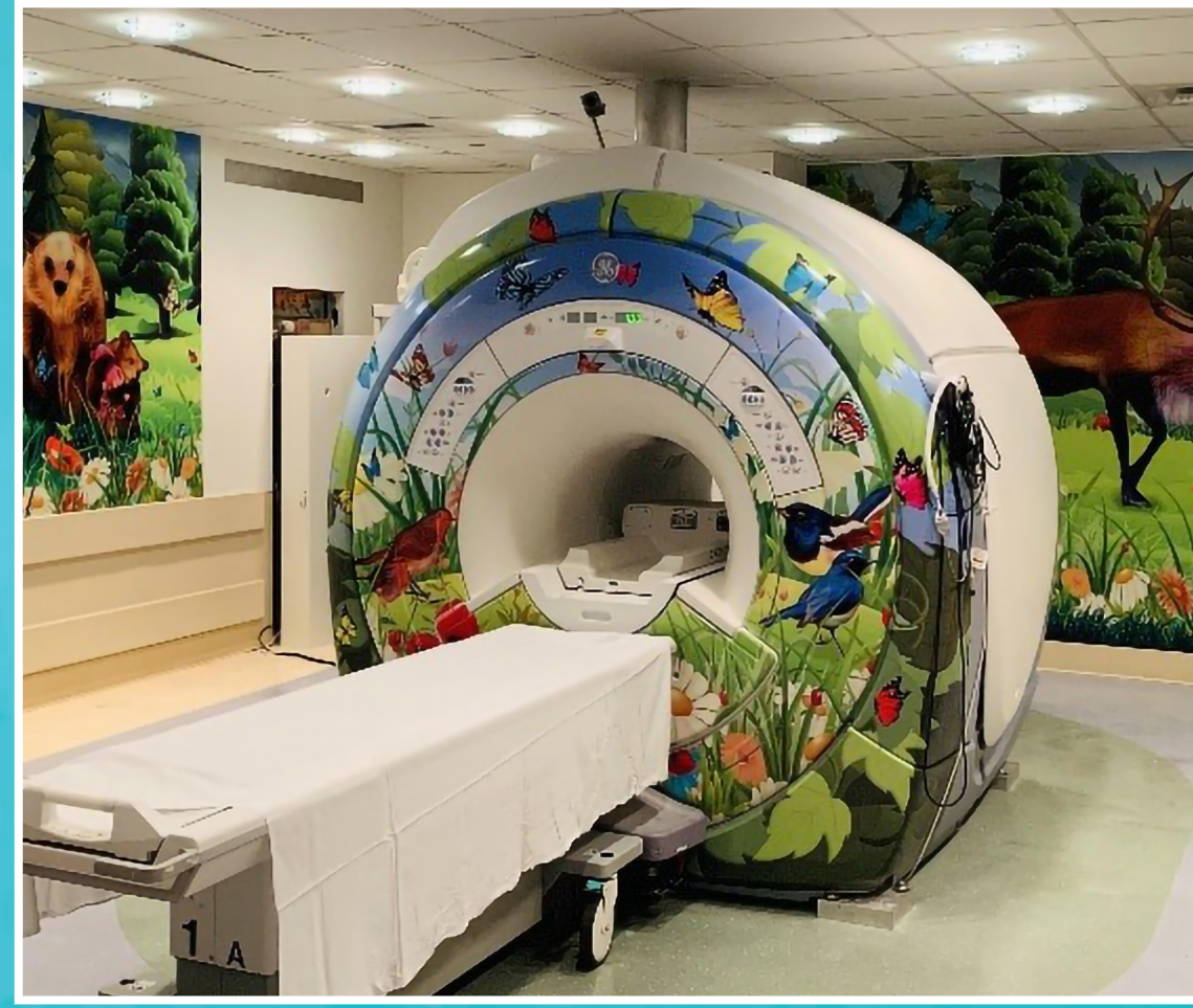
La decoración infantil y gafas para ver películas permiten tener una experiencia sin estrés durante las resonancias magnéticas