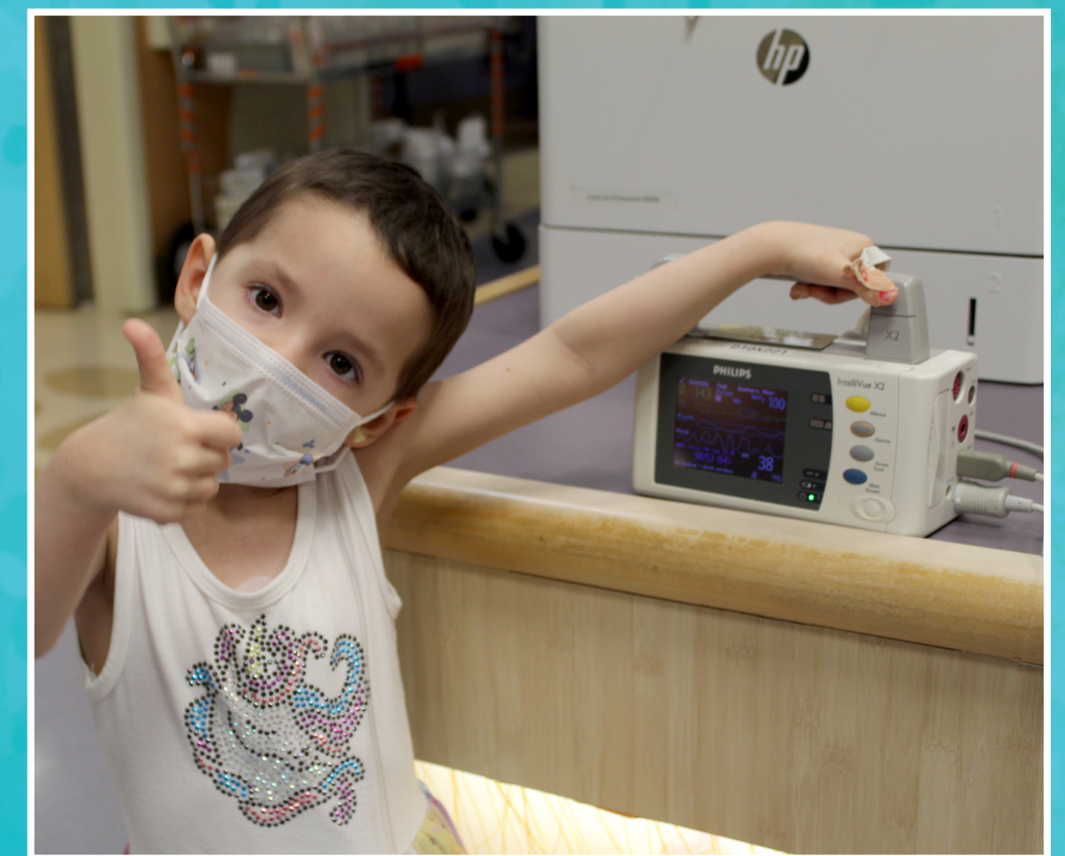
Con monitores inalámbricos, los niños pueden estar fuera de sus habitaciones y el personal aun así puede controlar sus constantes vitales