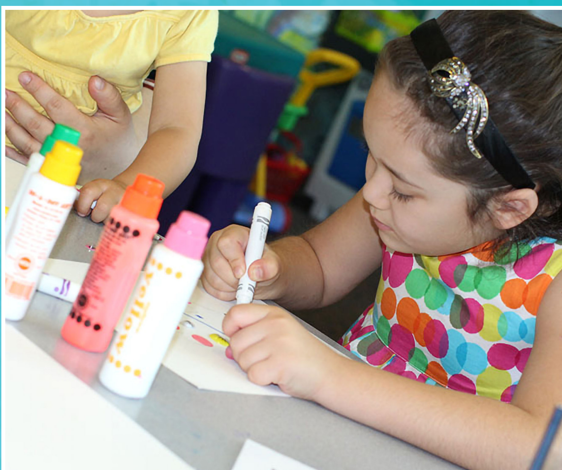
Terapia artística para que los niños puedan expresarse y compartir sus experiencias