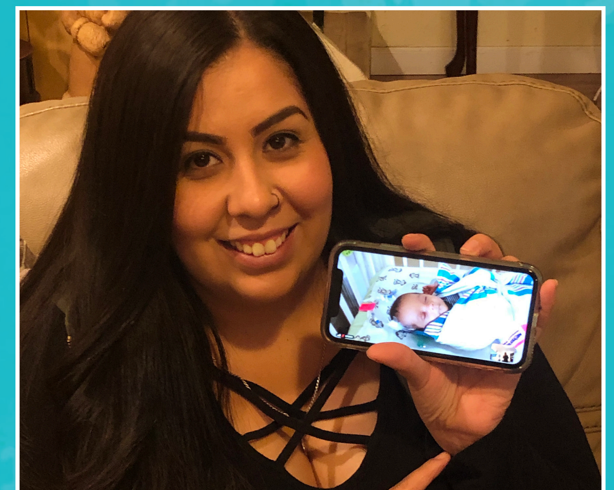
Una cámara web para cada cama de la NICU (Unidad de Cuidados Intensivos Neonatales) para que los padres puedan ver a su bebé cuando no están al lado de la cama

El 100% de los donativos ayudan a los niños que reciben tratamiento en el UC Davis Children's Hospital (Hospital Infantil de UC Davis). Es el único hospital de la red Children's Miracle Network de la región.